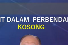
UNIT AUDIT DALAM PERBENDAHARAAN KOSONG