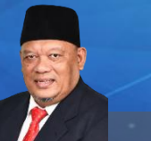
BAHAGIAN KAWALAN KEWANGAN STRATEGIK & KORPORAT GHAZALI BIN HIZAM